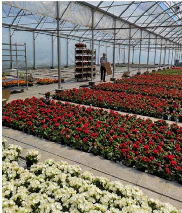
Lilleilu ootab poodi saatmist.