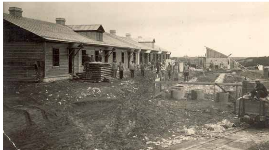
Jägala puupapivabriku töölistmaja ehitus (foto vahemikust 1924–1928).

Nüüd valgustatakse tuletor- ni petrooleumiga. •