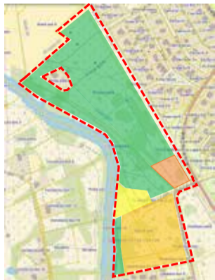
JÕEÄÄRE PIIRKONNA TSONEERIMISKAVA

Ettepanekutes toodi välja erinevaid ideid, kuidas luua kohalikele elanikele silmailu pakkuv looduslik ja turvaline koht sportimiseks, jalutamiseks ja lastele mängimiseks, kus leiduks tegevust igal aastajal ning uus elamispiirkond, mis arvestaks nii Loo ülejäänud elanike vajadustega, olemasoleva loodusega, kui ka pakuks uutele elanikele inimsõbr