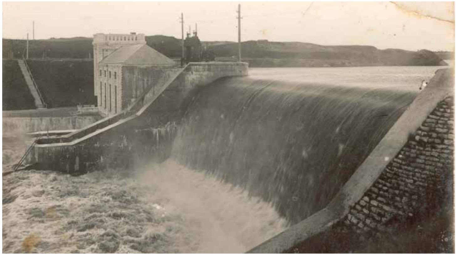
Linnamäe hüdroelektrijaam (foto vahemikust 1924–1928).

Jägala koske, Eesti Niagarat ei ole enam. Jõa puupapivabrik, Tallinna tselluloosi ja puupapivabriku osakond, neelas selle ühe kose vee. Seda on tema- le tarvis suurte masinate käimapanemiseks. 6–7 meetri laiust tsementkanalist mööda juhita- kse vesi pool kilomeetrit ülal-